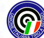
UNIONE ITALIANA TIRO A SEGNO