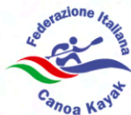
FEDERAZIONE ITALIANA CANOA KAYAK