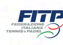
FEDERAZIONE ITALIANA TENNIS E PADEL