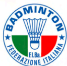
FEDERAZIONE ITALIANA BADMINTON