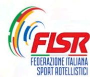
FEDERAZIONE ITALIANA SPORT ROTELLISTICI